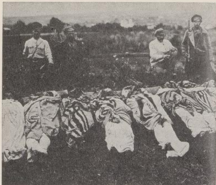
10. august 1919: Kosakker viser frem likene av jøder de har har jaget og myrdet.

«De sorte hundrede» og la ikke skjul på at han selv var medlem. Holdningen til jødene var slik at makthaverne trengte ikke anstrenge seg for å få folkets støtte til teorier om at de revolusjonære var jøder som ville undergrave alt russisk.