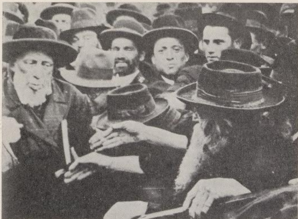
En chassidisk rabbi omgitt av sine tilhengere

Fars ansikt ble hvitt, rolig, litt skuffet. Han skjønnte hva som hadde hendt her: logikk, kald logikk var igjen iferd med å rive ned troen, drive ap med den, latterliggjøre den, skjelle den ut.