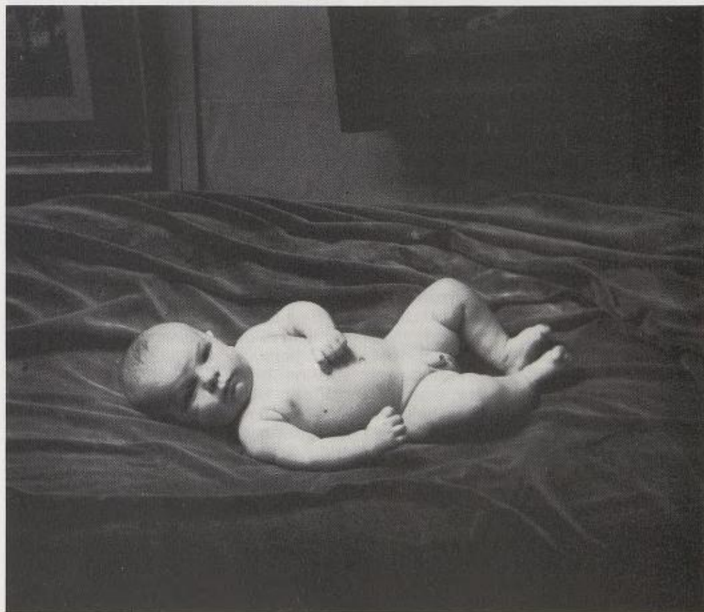
Jeg er omnipotent!

Som det fremgår av eksemplene, har foreldre som selv har et vanskelig forhold til egen narsissisme, lett for å overføre dette til barna. Den kanskje mest uskyldige og mest vanlige form