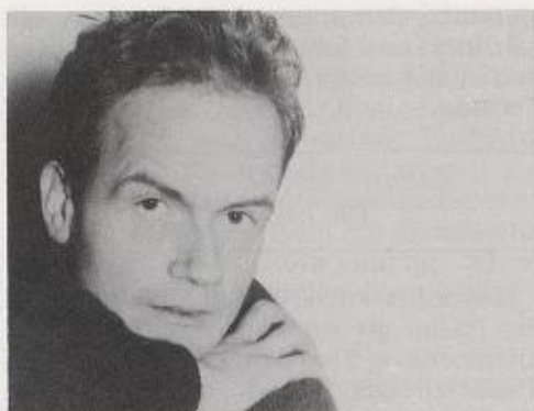
Kjetil Bjørnstad (1952) er både forfatter, dramatiker, komponist og musiker. Han debuterte 20 år gammel med en diktsamling.

– Han irriterer meg kolossalt. Han er feig og uopplevd. Det er en redsel i ham som opptar meg. En jeg-løshet et sted. Han mangler forankring i seg selv som individ. Derfor har han lite å stille opp. Han har få krav å komme med. Han er redd for å såre og ta ubehagelige oppgjør. Han våger ikke