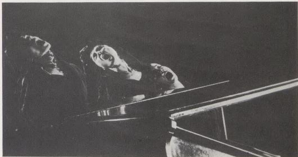
Du er min gutt, er du ikke?

rer også ved dypere strenger i Johannes: