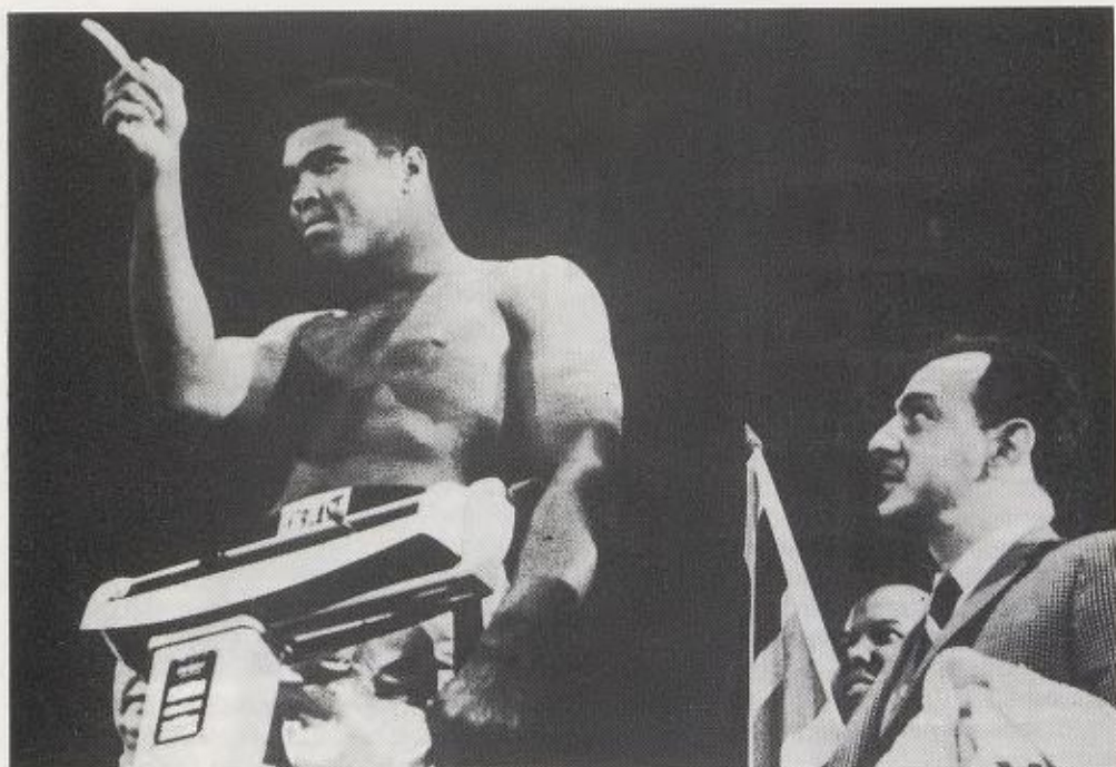
Jeg er størst, best og vakrest!

innenfor rekkevidde og derfor et incitament for noen, men kan være en flukt fra realitetene for andre.