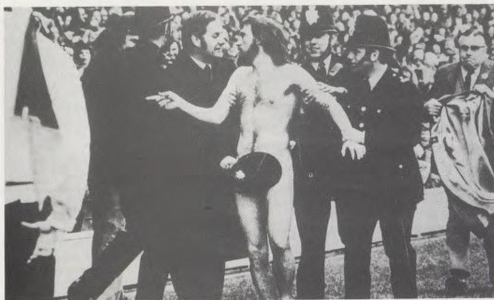
Narkissos født påny?

samme bevegelser, men er ellers util- snakkelig og uopnåelig. I fortvilelse over aldri å nå sin elskede dreper Nar- kissos seg selv, eller som hos Ovid, han ganske enkelt smelter bort som voks. Hans siste farvel til sitt eget speilbilde er det bare Echo som besvarer. Og nar- sissen, blomsten, er det eneste hans søstre finner der de leter, selv sitter Narkissos for alltid i dødsriket og be- trakter sitt speilbilde i dødens elv Styx.